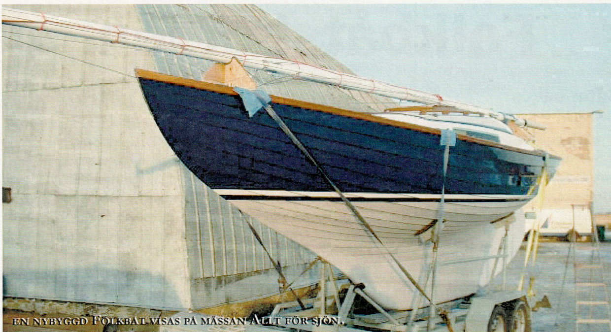
EN NYBYGGD FOLKBÅT VISAS PÅ MÄSSAN ALLT FÖR SJÖN.

Svenska Folkbåtsförbundet, SFF , är en ideell organisation som har till ändamål att tillvarata svenska folkbåtsseglares intressen i och utanför Sverige. Förbundet är uppdelat i regionala Flottiljer, som skall verka lokalt för sina seglare. SFF är anslutet, dels som ett klassförbund till SSF - Svenska Seglarförbundet och dels till NFIA - Nordic Folkboat International Association, som är folkbåtsseglarnas internationella organ.