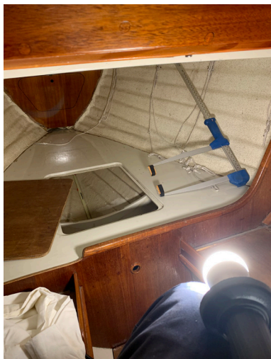
Förkojen kontrolleras lätt

enkelt alternativ jämfört med till exempel drakarnas svingtest som beskrivs nedan.