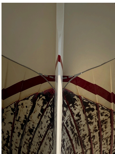
Stora akterspegelns underkant (streckad) lyfts upp 2 dm när två gastar går till fördäck

Den totala fartökningen blir alltså minst 0,12 + 0,12 = 0,25 knop.