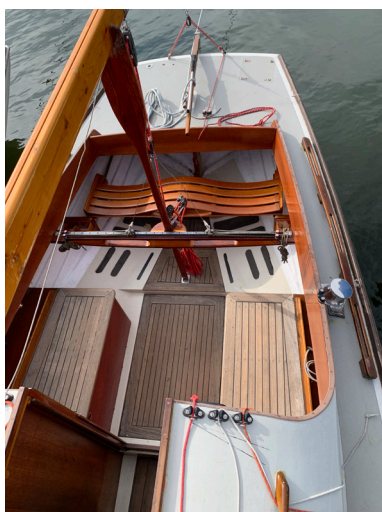
En trevlig sittbrunn att ta en öl i med vänner

Man kan jämföra dessa 140 meter med betydelsen av en ojämn botten, eller en lite för tung båt. Vi har tidigare räknat ut (se Folkbåten en modern klassiker , 2006, s. 82–85) att en lite slarvigt penselmålad och lätt beväxt botten sinkar 300 till 600 meter på samma bana. Och 100 kg övervikt på båten sinkar cirka 50 meter.