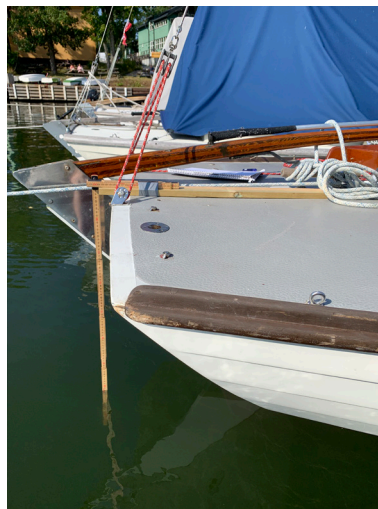
Så lätt mäter man akterdäckshöjden

Det går lätt att mäta detta, en tumstock, en liten trälist och lite tejp är allt som behövs, se bild. Vår erfarenhet är att man lätt mäter med en noggrannhet på \pm 0,2 cm, förutsatt att man är i en hamn med stilla vatten, och det är man nog oftast. Skulle vågor ändå skapa problem kan man göra som IF-båtarna gör: tejp fast ett genomskinligt plaströr, innerdiameter minst 1 cm, nertill på tumstocken med endast ett litet hål nertill. Vattnet i röret jämnar då ut vågorna. Det får väl inte vara för stark vind heller akterifrån – det kan bli lite för stora värden då.