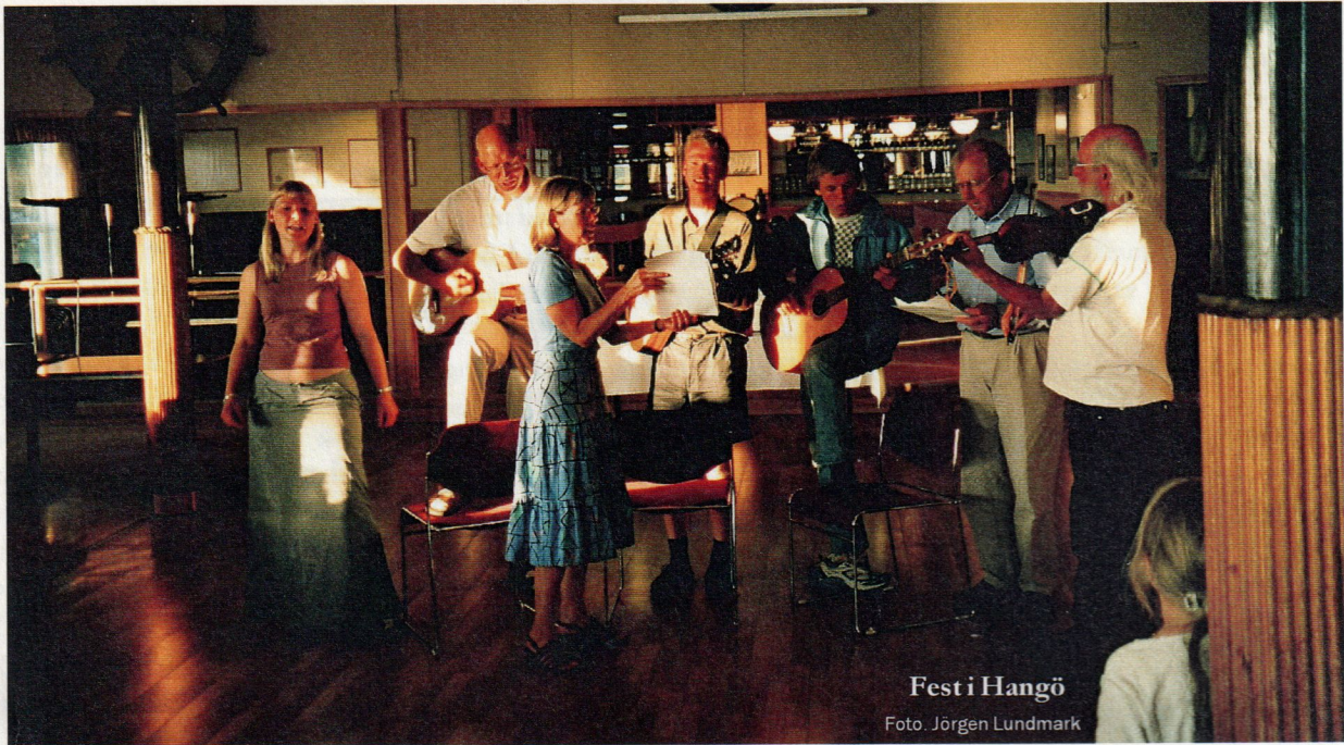
Fest i Hangö