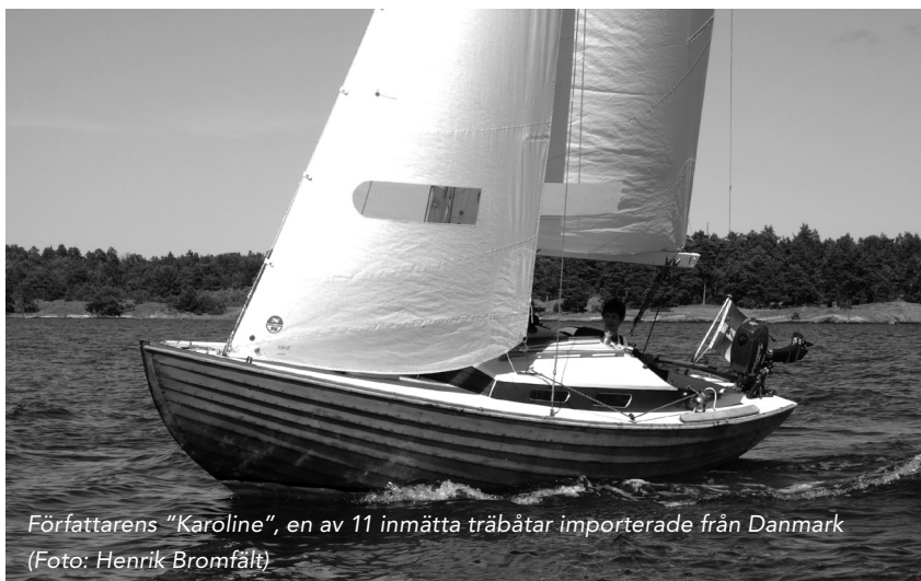
Författarens "Karoline", en av 11 inmätta träbåtar importerade från Danmark