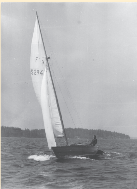
2:a pris: Bo Johansson.