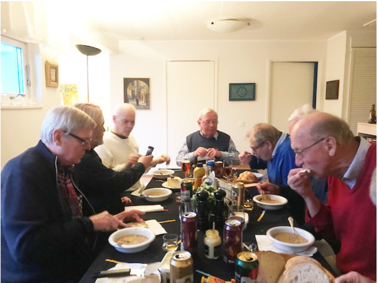
Delar av Folkbåtsgänget som käkat ärtsoppa under vinterhalvåret sedan 1970! Från vänster: fd1000, 1323, 1279, fd1340, fd1354, fd723 + fd456, 2 + 1289.