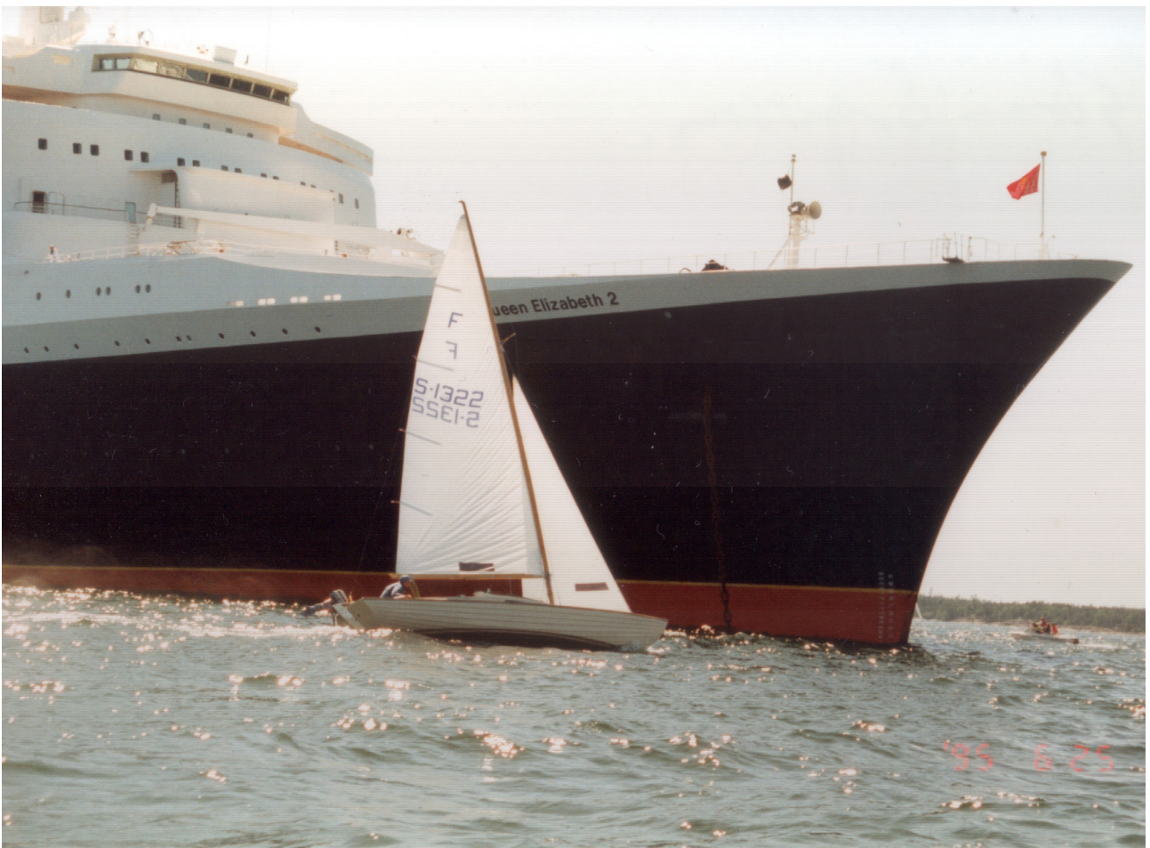
Här var det nära. Nynäshamn 1996.