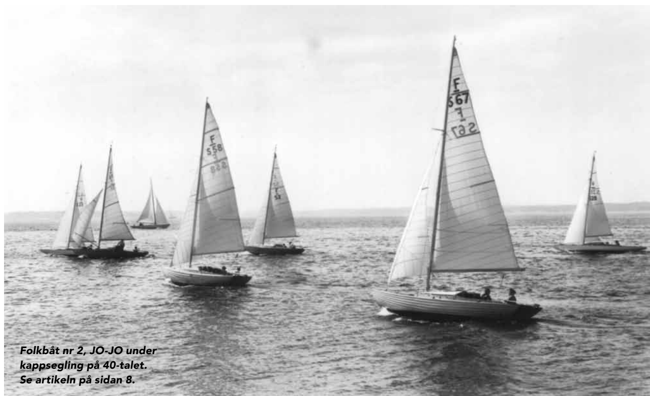
Folkbåt nr 2, JO-JO under kappsegling på 40-talet. Se artikeln på sidan 8.

Ha en riktigt skön sommar! STYRELSEN OFK