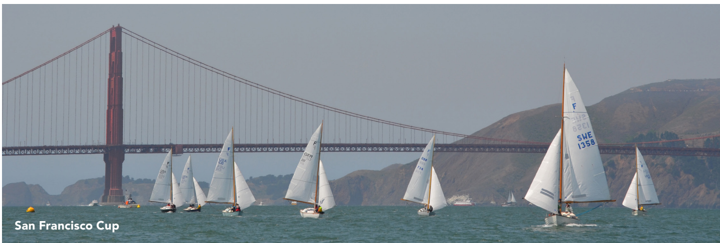
San Francisco Cup