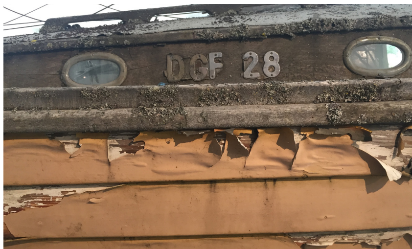
Båtens segelnummer är okänt med ledtrådar finns