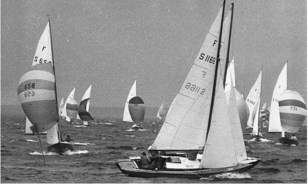
Friska vindar under SM i Grisslehamn 1974

att bedöma. Minnesvärd var den i alla fall för dem som kommer ihåg något. Det lär finnas en film från festen. Kanske den kan lära våra ungdomar ett och annat.