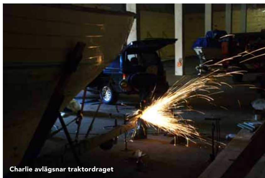
Charlie avlägsnar traktordraget

När vi hade några mil kvar till Linköping slog karma till oss hårt i ma-