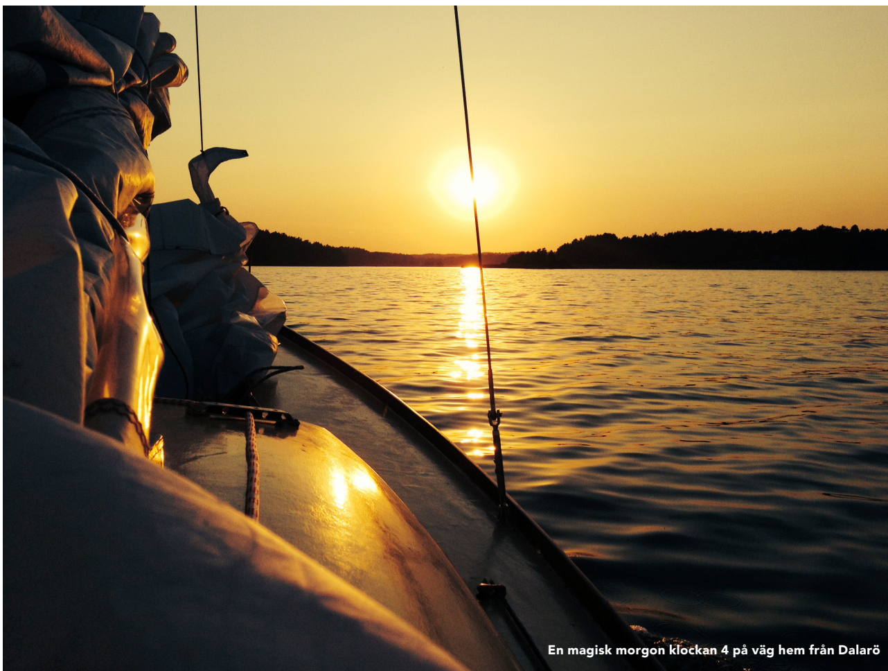
En magisk morgon klockan 4 på väg hem från Dalarö

samhet anade vi en stor sandbank. Det var någonstans mellan Nynäshamn och Nyköpings skärgård. Var det en illusion eller var vi på väg rakt upp på grund? När havet inte bjudit på så många förändringar kan ju vad som helst uppstå. Men var det verkligen möjligt med en stor sandbank mitt här ute, så långt ifrån land? I lätt panik gjorde vi en 180 graders-vändning samtidigt som vi såg en annan båt åka rakt in i grundet. Som inte var något grund. Det som sett ut som sand var en halvmeter tjockt lager av sandgula alger. Lättade och äcklade tog vi kurs igen. Det kändes som att segla i en öken full med myggor.