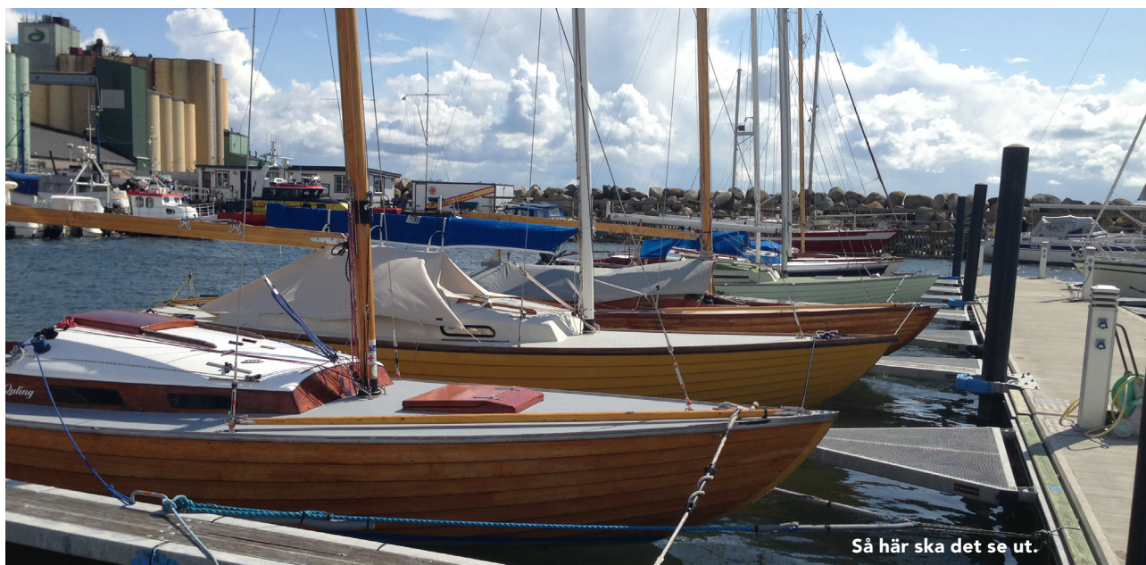
Så här ska det se ut.